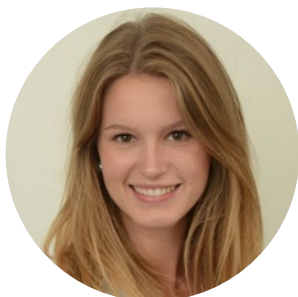
Virna Conti Députée UDC Genève